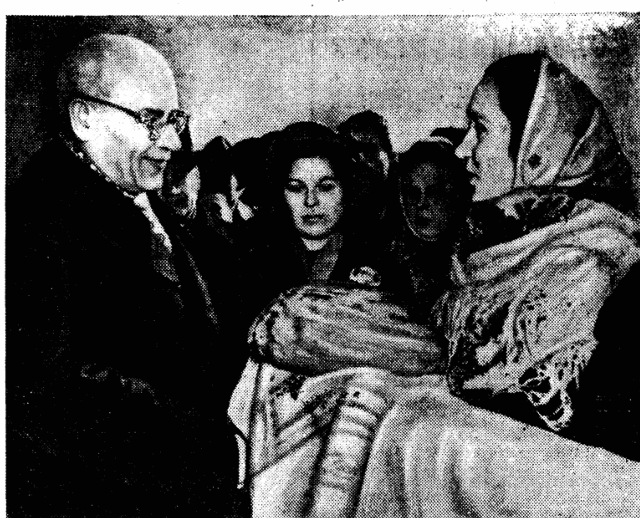
Встреча делегации Польской Народной Республики в Киеве. Трудящиеся столицы Украины преподносят хлеб-соль Первому секретарю ЦК Польской объединенной рабочей партии Владиславу Гомуле.