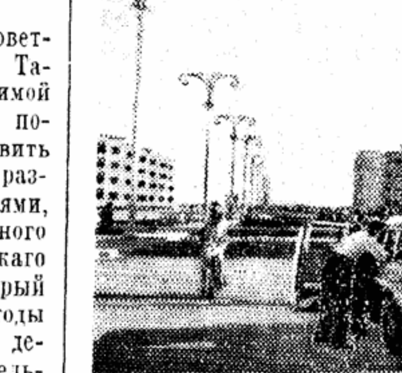
Порт-Саид, улица Сталинграда

На следующий день Кох прибег к новой провокации. Он потребовал отложить судебное разбирательство, оспаривая правоту решений Нюрнбергского международного трибунала. Мало того, Кох подверг сомнению вопрос о моральном праве польского суда рассматривать его дело.