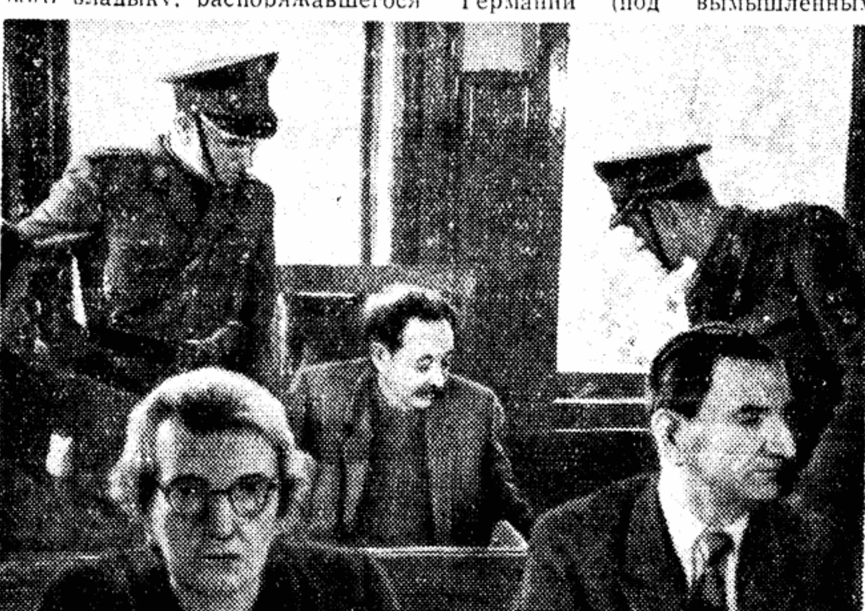
Вот он — нацистский палач и убийца Эрих Кох — на скамье подсудимых!

жизнями миллионов людей. Весь его облик говорит: по-видимому, теперь скрыться не удастся, придется отвечать за муки и смерть погибших жертв.